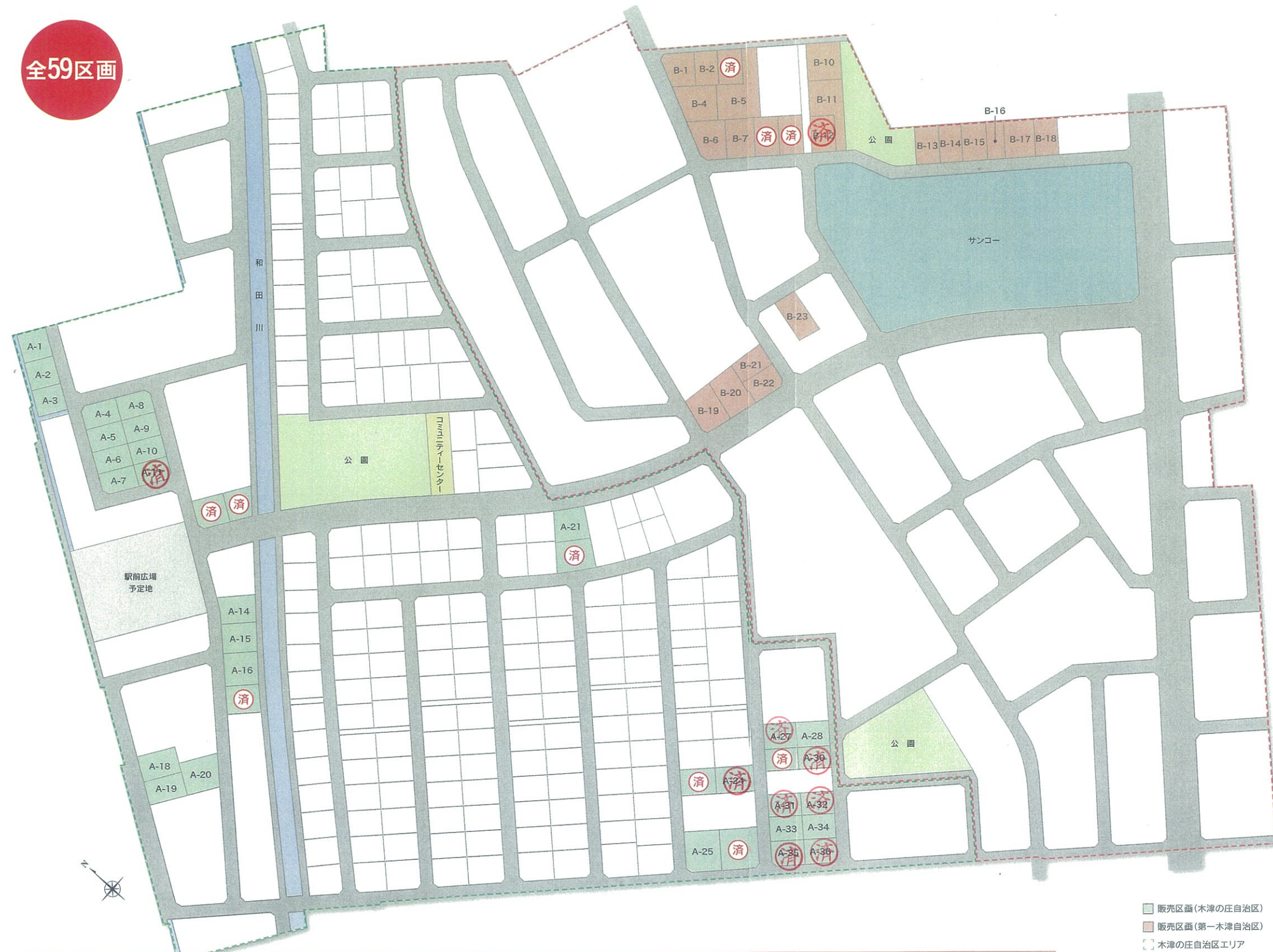
木津土地区画整理事業一般換地販売 (木津の庄・第一木津) 価格